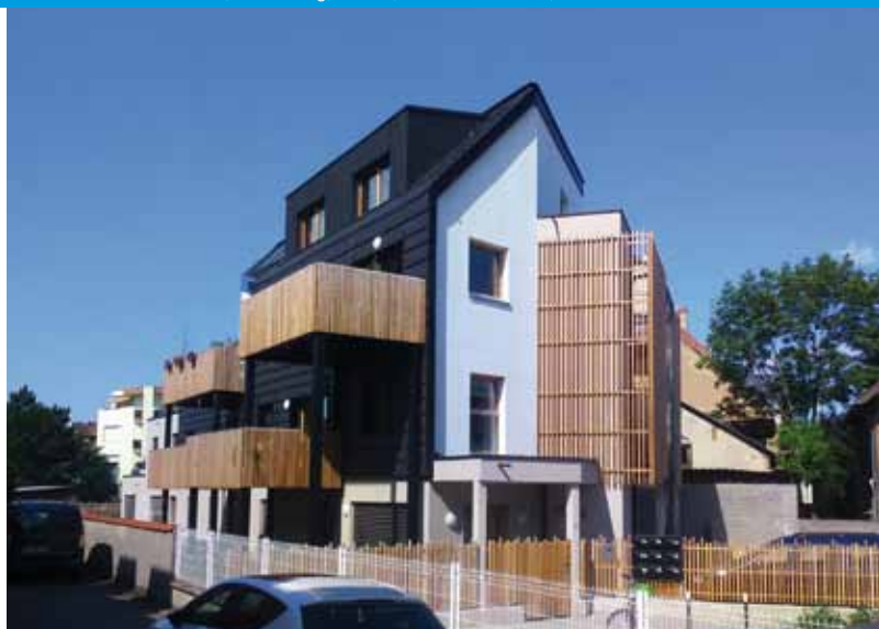
Making Hof, Strasbourg, France, LAMA Architectes, 2016

Urban Hôtes, Strasbourg, France, Atolh Architecture, 2017