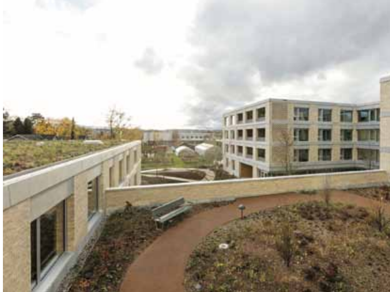
Mehrgenerationenwohnen Maiengasse, Basel, Schweiz