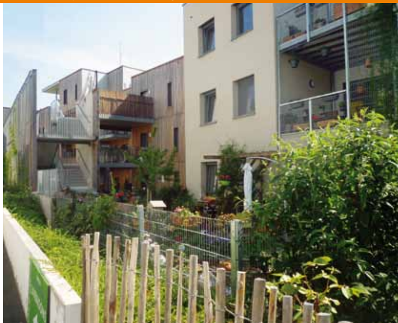
Maison citoyenne de Neudorf Strasbourg, France, Atoll architectures, 2016